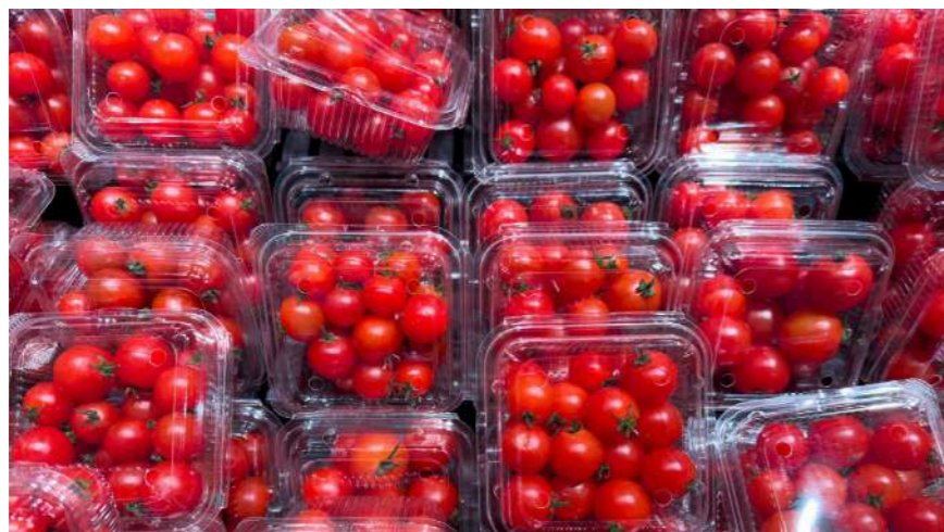
Au rayon des fruits et légumes, les sachets et barquettes en plastique s'incrument, alors que la loi Agec prévoyait leur interdiction.