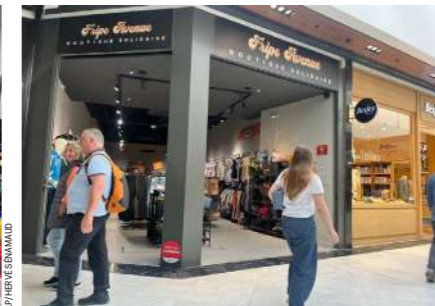
Le Chesnay-Rocquencourt (Yvelines), le 7 mai. En un an et demi, Fripe Avenue s'est fait une place au milieu de Dior, Lancel, Ralph Lauren...

Plus marquant encore, la Croix-Rouge a carrément investi la galerie marchande du centre Carrefour avec une boutique solidaire de 160 m 2 , ouverte depuis février 2025 six jours sur sept. La zone accueille aussi Ding Fring, présentée comme la plus grande friperie solidaire du départe-