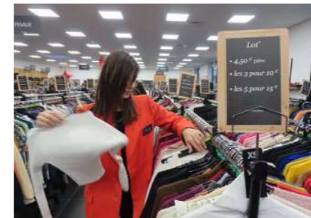
Saint-Maximin (Oise), décembre 2025. À la friperie Ding Fring, on renouvelle jusqu'à 3 tonnes de nouveautés chaque semaine.

La surface de la friperie solidaire Ding Fring, à Saint-Maximin (Oise)