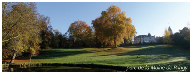
parc de la Mairie de Pringy

Dans le cadre de la réforme territoriale engagée par l'Etat sur le regroupement d'intercommunalités, les communes de Pringy et Saint-Fargeau-Ponthierry ont intégré la Communauté d'Agglomération Melun Val de Seine le 1 er janvier 2016.