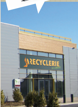
Rue de la plaine de la Croix Besnard - Parc d'activités 77 000 Vaux-le-Pénil

Toutes les infos pratiques sur : www.lombric.com