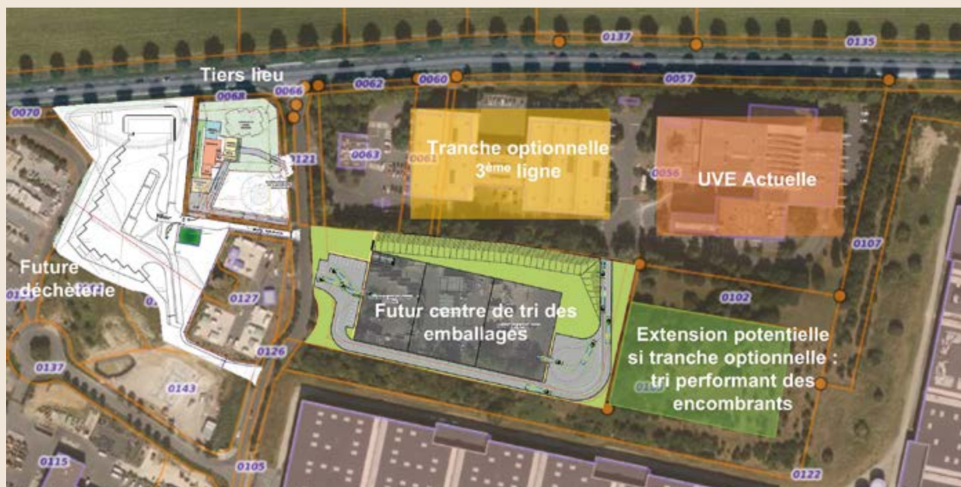
Le site industriel de Vaux-le-Pénil demain, si l'ensemble des aménagements étudiés est retenu

Les deux derniers équipements constituent une hypothèse de travail du SMITOM-LOMBRIC : la décision d'affermissement de la tranche optionnelle (troisième ligne de valorisation énergétique) des contrats en cours de consultation tiendra compte du bilan de concertation du SMITOM-LOMBRIC. Si cette décision était prise, elle aurait un impact sur le lieu et la performance du centre de tri des encombrants et tout-venant.