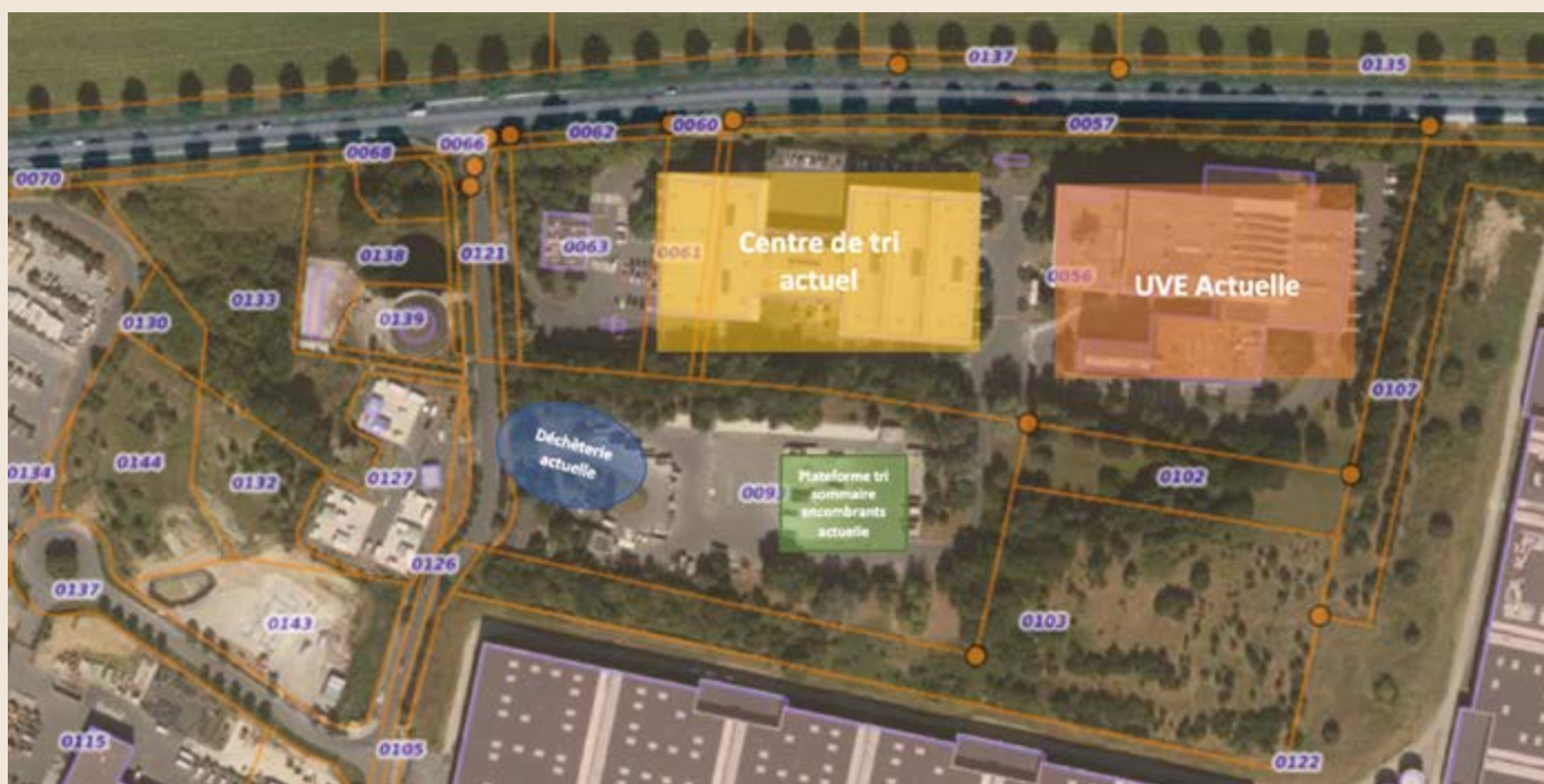
Le site industriel de Vaux-le-Pénil aujourd'hui

L'exploitation et la gestion des équipements de traitement sont confiées par délégation de service public à Génériss, filiale de Veolia Propreté.